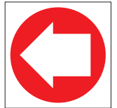
FIR 035 200 x 200 FIR 036 400 x 400