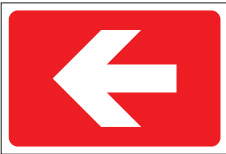
FIR 027 200 x 300 FIR 028 400 x 600