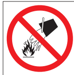
FIR 043 200 x 200 FIR 044 400 x 400