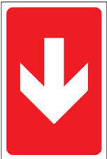
FIR 025 200 x 300 FIR 026 400 x 600