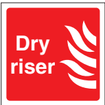
FIR 049 200 x 200 FIR 050 400 x 400