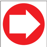
FIR 037 200 x 200 FIR 038 400 x 400