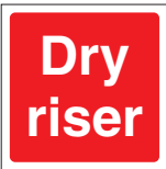
FIR 051 200 x 200 FIR 052 400 x 400