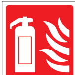
CO 2 FIR 041 200 x 300 FIR 042 400 x 600