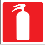
FIR 003 200 x 200 FIR 004 400 x 400