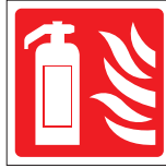
FIR 007 200 x 200 FIR 008 400 x 400