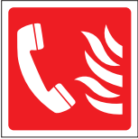
MAN 013 200 x 200 MAN 014 400 x 400