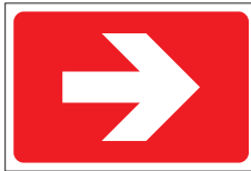
FIR 029 200 x 300 FIR 030 400 x 600