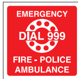
EMERGENCY DIAL 999 FIRE - POLICE AMBULANCE FIR 055 200 x 200 FIR 056 400 x 400