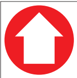
FIR 039 200 x 200 FIR 040 400 x 400