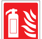
Dry powder FIR 047 200 x 300 FIR 048 400 x 600