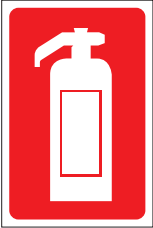
FIR 001 200 x 300 FIR 002 400 x 600

Non-automatic fire equipment should display safety signs in accordance with the Safety Signs and Signals Regulations 1996. These regulations require the fire fighting equipment to be marked with a permanent sign board in red. All fire signs comply with DIS3864 Part 1 which requires a white border on all fire signs.