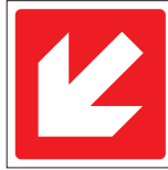
FIR 019 200 x 200 FIR 020 400 x 400