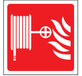
FIR 011 200 x 200 FIR 012 400 x 400