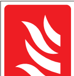
FIR 015 200 x 300 FIR 016 400 x 600