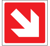
FIR 023 200 x 200 FIR 024 400 x 400