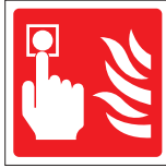
FIR 005 200 x 200 FIR 006 400 x 400