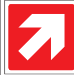
FIR 021 200 x 200 FIR 022 400 x 400