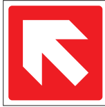
FIR 017 200 x 200 FIR 018 400 x 400