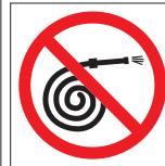
FIR 045 200 x 200 FIR 046 400 x 400