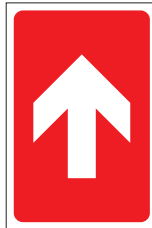
FIR 031 200 x 300 FIR 032 400 x 600