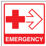
EMERGENCY FIR 053 200 x 200 FIR 054 400 x 400